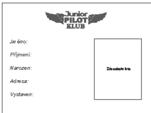
přední strana průkazu